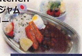
飲食・物販ブース