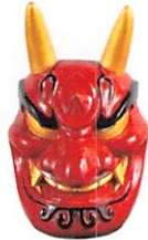
花祭り面 茂吉鬼(愛知県)