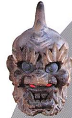
瀧山寺追儺面 祖父鬼(愛知県)