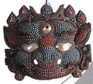
ラケーの仮面 (ネパール)