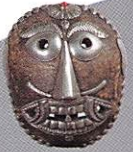
ぎとう師の面 (チベット)