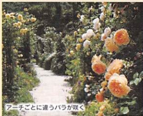
アーチごとに連うバラが咲く