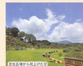
芝生広場から見上げた空

7月、峠へ向かう道はアジサイでいっぱい。その後は、背丈のある植物たちの競演。セミやトンボ・蝶たちの戯れ、国蝶オオムラサキにも会えるかもしれません。