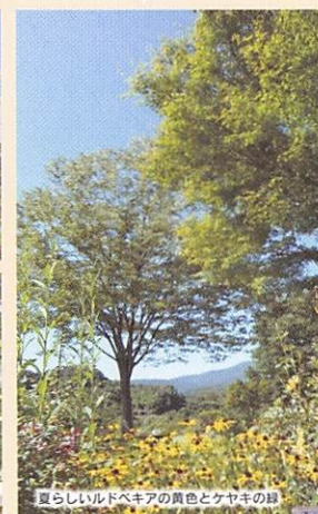
夏らしいルドベキアとケヤキの緑