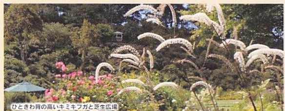
ひとさわりの高いキキョウと芝生広場