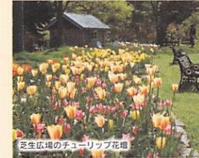
芝生広場のチューリップ花壇