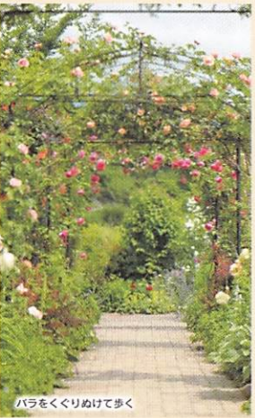
バラをくぐりぬけて歩く