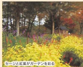
セージと紅葉がガーデンを彩る