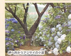
峠へ向かうアジサイの小道