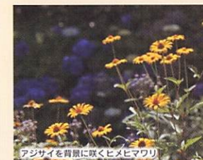
アジサイを背景に咲くヒメヒマワリ