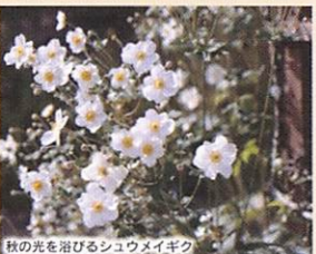
秋の光を浴びるシュウメイギク