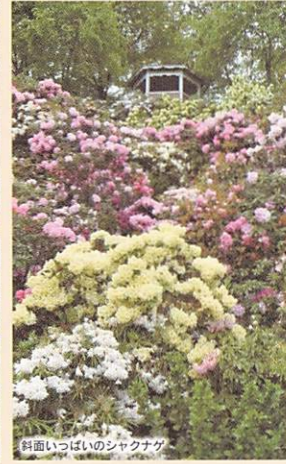
斜面いっぱいのシャクナゲ