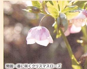
開園一番に咲くクリスマスローズ

4月、雪解けとともに咲く可憐な草花たち。リュウキンカやカタクリ、クリスマスローズなどが春の訪れを告げます。やがて林の中はツツジの赤やピンクに染まり、5月には山一面のシャクナゲや八重桜、チューリップが咲き乱れ「花満開の季節」を迎えます。