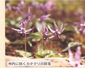
林内に咲くカタクリの群落