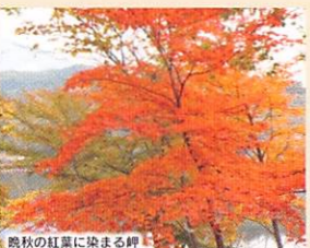
晩秋の紅葉に染まる坪

9月・10月・11月キキョウ、シュウメイギクが風に揺れ、秋バラの美しさが際立つ季節。セージやダリアが鮮やかに花壇を染め、やがて紅葉に包まれていきます。