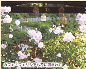
カフェ・フェリシアも花に囲まれて