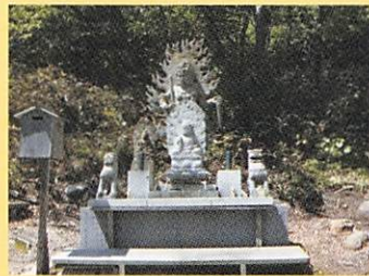
⑨ 奥の院 不動明王