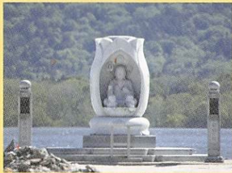
⑬ 東日本大震災供養塔