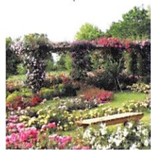
6月 7月 ローズガーデン