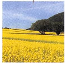
4月 5月 水仙、菜の花

四季それぞれの美しさに彩られたやくらいガーデン。 美しい花々たちとの出会いの思い出をお持ち帰りください。