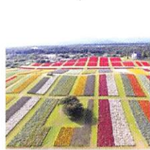
9月 10月 ふるるの丘の花々